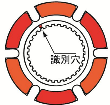
クッションングディスクの平面形状

ディスクを構成する6枚の摩擦面に交互にわずかな段差をつけて非常に効果的なクッションング機能をもたせています。